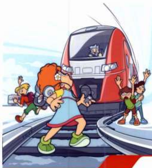
Сними наушники и капюшон при переходе железнодорожных путей! Они мешают заметить поезд!