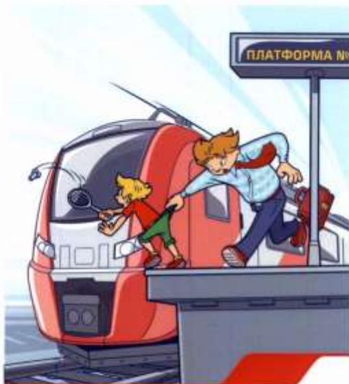
Железная дорога – не место для игр!